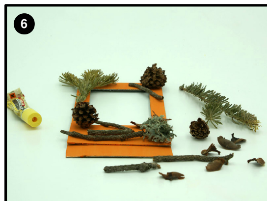
Espera a que se seque y pega los adornos como tú prefieras