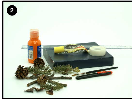
Material que necesitaremos