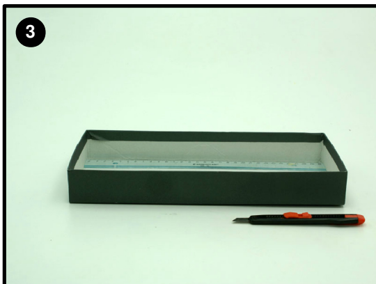
Con el cúter y la regla corta el centro de la tapa