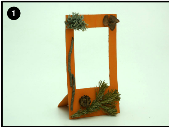
Construyamos juntos un marco de fotos